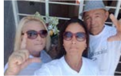
Movimiento Cristiano Liberación rindió homenaje a Oswaldo Payá en el Cementerio de Colón en La Habana.

(La policía impide el paso al Cementerio de Colón a más de 50 activistas del MCL, que iban a homenajear a OSwaldo Payá, tan sólo logran acceder 5)