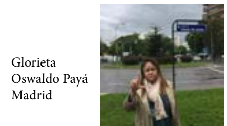
Glorieta Oswaldo Payá Madrid