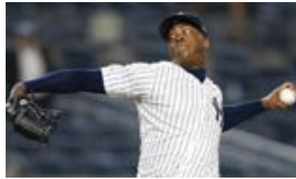
Foto: Aroldis Chapman, este mayo, con los Yankees.

Según un estudio de cuatro investigadores de las universidades de Harvard y George Washington y del Tata Institute de Bombay publicado en la revista científica Nature, el cubano se encuentra en los límites del ser humano: nadie puede ni podrá superar su 172 km/h en 2011. Los ocho años que lleva vigente su récord y el hecho que décadas atrás ya se registraran velocidades similares a pitchers como Bob Feller (1936-1956) y Nolan Ryan (1966-1993) ya advertían una evolución frenada, pero el trabajo confirma que se ha llegado al tope.