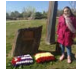
Monolito Oswaldo Payá Las Rozas, Madrid