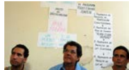
por otros, siempre ha mantenido una vitalidad que a lo largo de sus 30 años de existencia le ha permitido crecer, rehacerse y renovarse continuamente.

La primera generación del MCL redactó el Llamamiento al Diálogo Nacional (1990) y un Programa Transitorio (1992) así como el documento fundacional de ese primer gran intento de unidad de la oposición que fue Foro Cubano (1994), e intentó participar en las llamadas “elecciones” de 1997, lo que demostró la imposibilidad de participación política de los cubanos con esa Ley Electoral todavía hoy vigente.