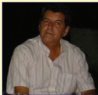
Oswaldo Payá Sardiñas