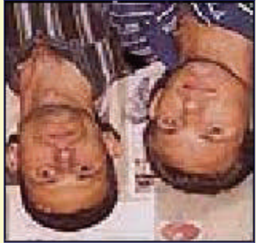
Brothers Luis Enrique and José Daniel Ferrer