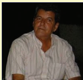
Oswaldo Payá Sardiñas