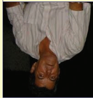
Oswaldo Payá Sardiñas

Read the Full Text at www.nationaldialoguecuba.org .