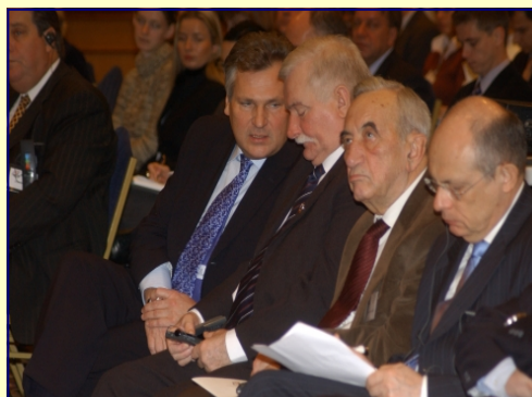
Lech Wałęsa y Aleksander Kwaśniewski